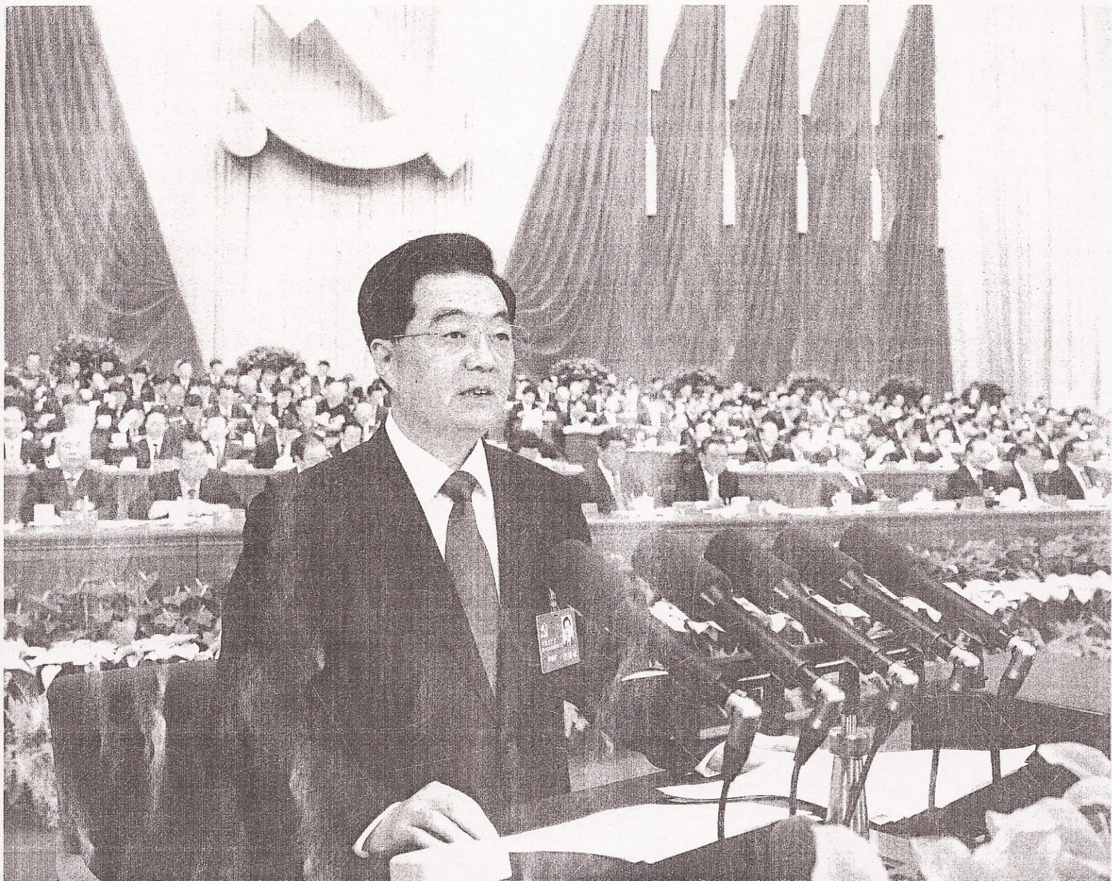
胡锦涛代表十七届中央委员会向大会作报告。

2012年的中国,因为中国共产党第十八次全国代表大会的召开,具有了非凡的历史意义。