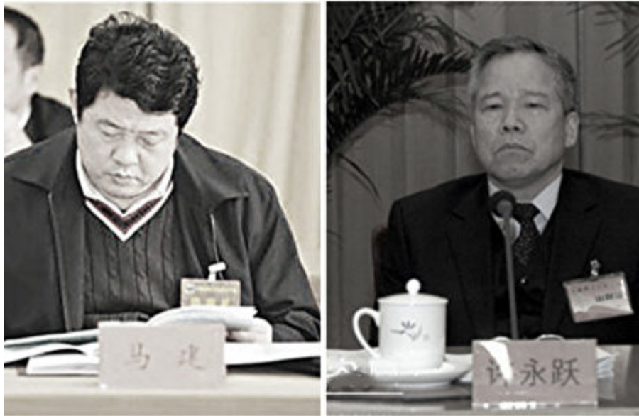
图为中共国安部前部长许永跃（右）和前副部长马建（左）。

在耿惠昌主政期间，国安部高官违规操作层出不穷，达到历史高峰。其中马建丑闻最多，被指是公器私用的典型。