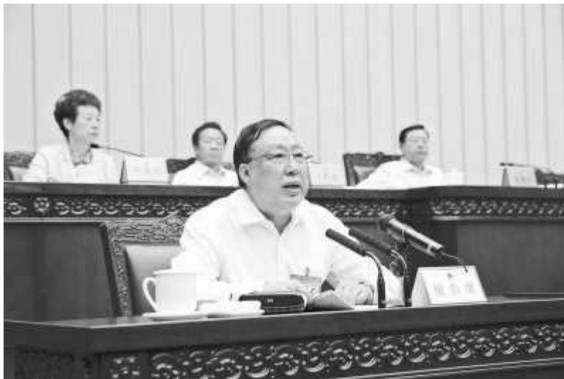
11月7日，耿惠昌的国家安全部部长职务被免，由陈文清接替。（网络资料图片）